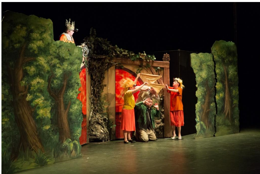
21. Fogi Színház – Árgyélus királyfi és Tündér Ilona (Nagyszínpad, november 19. 11.00)