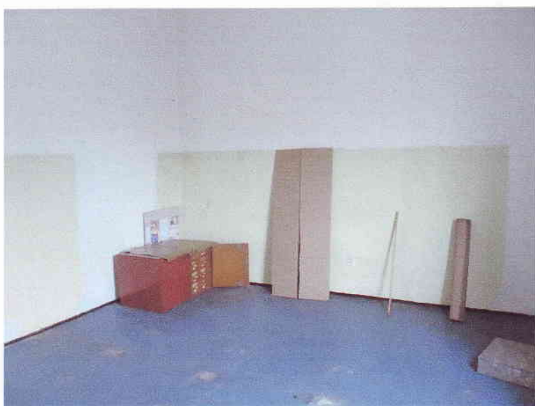
A Hang-és médiatár az új helyén, a Baross úti épületben