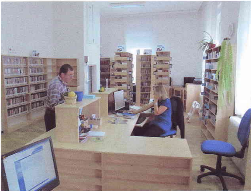
A Milkovich-Zámory (muzeális) gyűjtemény leendő helye: a volt igazgatói iroda, titkárság és gazdasági iroda