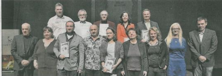
A Magyar Radír 2016 pályázatra beérkezett művek közül a legjobb díjazottak. Képünkön a nyertesek, a zsűri tagjai, a pályázat kiírói és az előadóművészek láthatók.