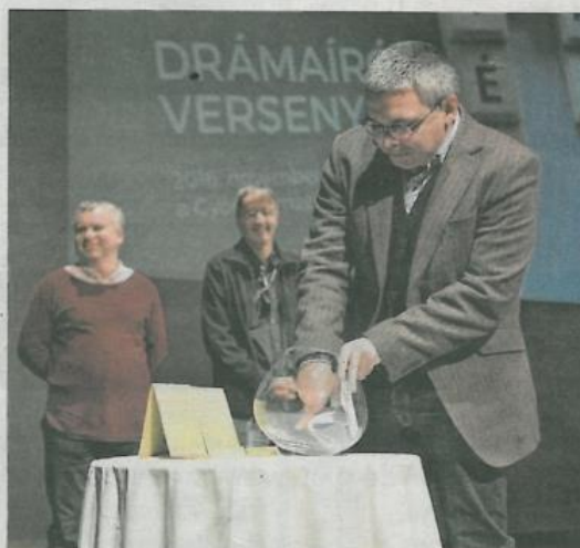
A XVI. Győri Könyvszalon alkotói díjával kitüntetett Dragomán György író, esszéista, műfordító húzta ki a drámaíró verseny témáját.