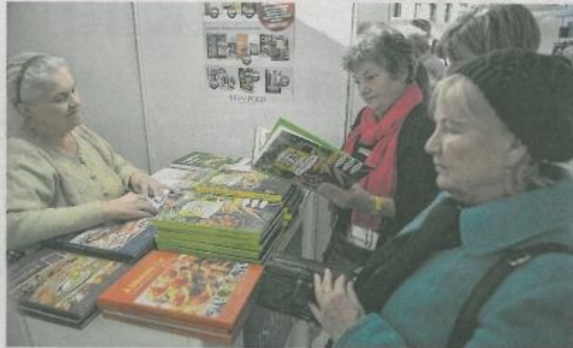
A Kisalföld standján népszerűek voltak lapunk kiadványai, elsősorban három legújabb könyvünk.

– Egyedülülben írok, fotelban ülve, miközben nézem a fehér falat és előbb-utóbb meglátom, amit látni kell. Persze van, mikor ez csak egy év múlva vagy még később történik meg – említette lapunknak a díjazott. – Mindig azt képzeltem, hogy évekig ülök a szobámban és írom a könyveimet. És azt képzeltem, hogy az idő valamiféle hatalmas magaslat, s ahogy a mesében a kismadár csőrével a hegyet, az írók írás közben „elkoptatják” az órákat, napokat, vagyis elkészül a történet. Két serpenyőt láttam magam előtt. Az egyikben az van, amit én tettem bele, a másik pe-