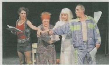
A közönségnek a Drón család életét színpadra állító „Kittiltották a Drónokat” darab tetszett legjobban.

Drónok és Drónék is szórakoztatták a közönséget szombat este a Győri Nemzeti Színházban, a „Kortársasjáték” három előadásában. A drámaíró verseny közönségdíjas, Zalán Tibor által írt darabja végig nevette a nézőket, ugyanakkor fontos kérdésekre világított rá: milyen konfliktusokhoz vezetethet egy félreértés/féltértelezés és a drónnal való megfigyelés.