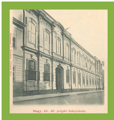
Magy. kir. áll. polgári leányiskola.

Mária Terézia rendelete szerint az intézmény „királyi akadémia”-ként működött tovább, majd II. József a tankerületek át-szervezésével Pécsre költöztette az intézményt. Küzdelmek árán, 1802-ben sikerült visszahozni városunkba, de a joghallgatók forradalomban vállalt szerepe miatt 1850-ben megszüntették. 1867-ben ismét újra-indult a jogakadémia, mely 1892-ig működött.