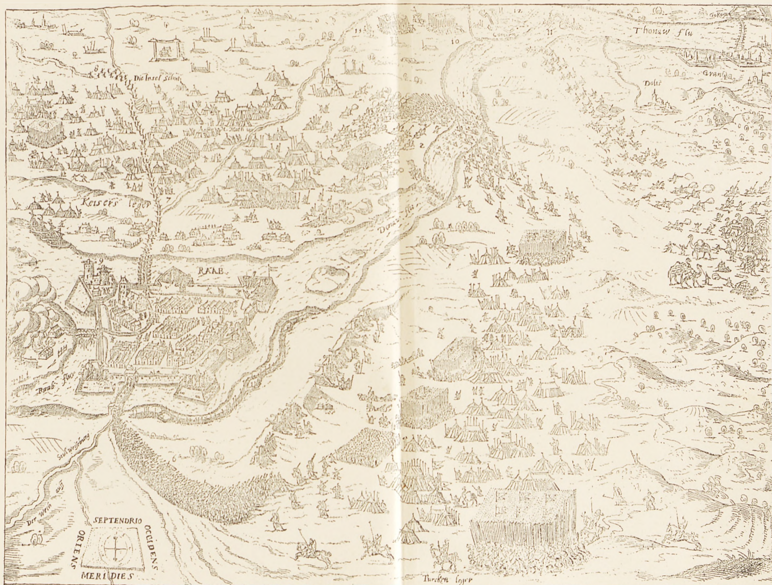
Contrafactur der Stadt Und Vestung Raab Wie die Unden Türcken belagert und endlich den 19 Septembris 1694 Erobert sampt andern hier in Verzeichnet geschachten so mit Ziffern in der Hützen erkläret Wirden