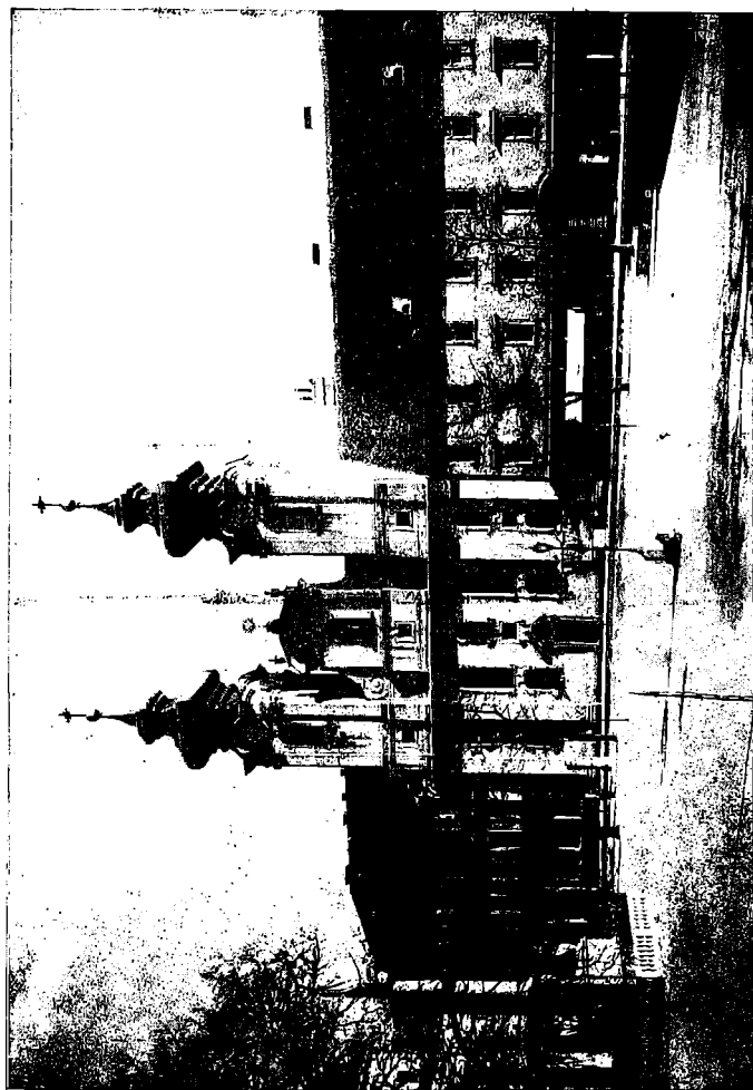
A jezsuiták, ma bencések temploma és rendháza a Széchenyi-tér felől.