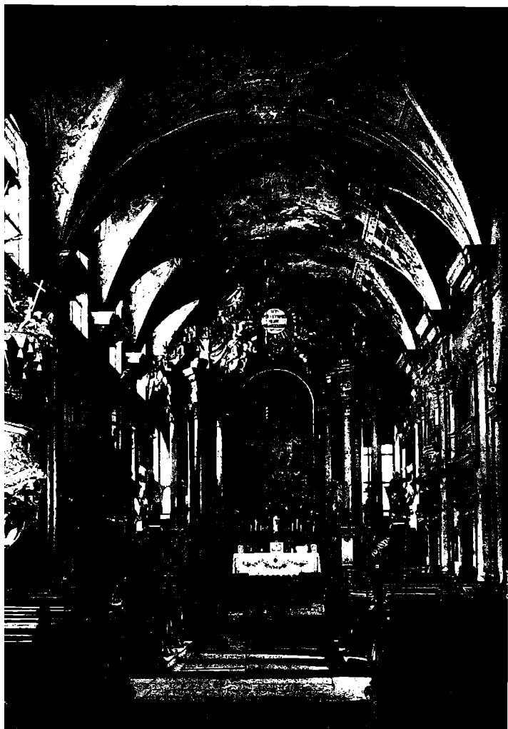
A Szent Ignác-templom belseje.